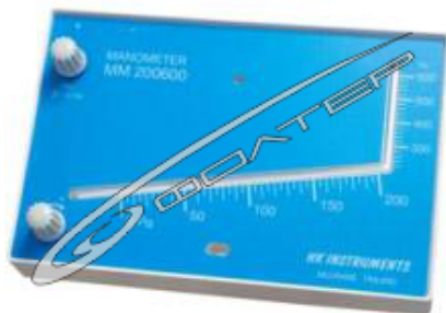
Рис.3 Жидкостной наклонный манометр типа MM