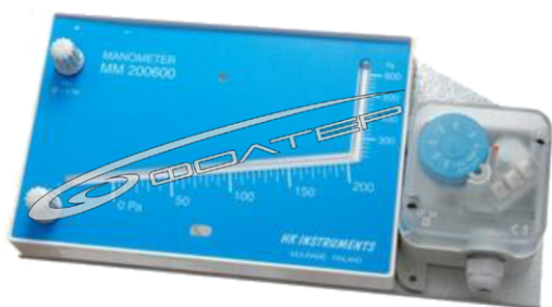
Рис.5 Контроллер фильтров типа MM/PS

В случае необходимости визуального контроля сопротивления фильтров с одновременной подачей электрического сигнала об изменении сопротивления могут использоваться совмещенные модели приборов контроллеры фильтров.