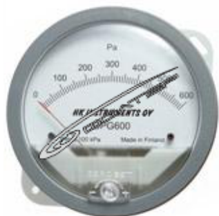
Рис.1 Дифференциальный манометр типа DPG

Дифференциальные манометры типа DPG и электронные датчики давления типа PS предназначены для измерения избыточного, вакуумметрического давления, а также разности давлений воздуха и неагрессивных газов и могут быть использованы для контроля сопротивления воздушных фильтров в секциях карманных фильтров типа СКФ; складчатых фильтров типа ССФ, в модулях воздухораспределительных типа МВ, а также в каких-либо других фильтрующих камерах.