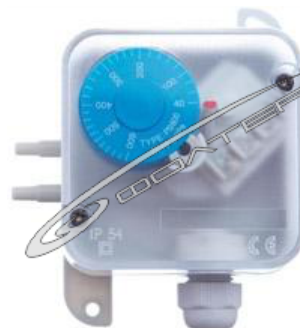
Рис.2 Электронный датчик давления типа PS