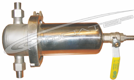
Рис.1 Фильтр ФСВ

Фильтры для очистки сжатого воздуха ФСВ повышают надежность и срок службы пневматического оборудования, станков и инструмента; улучшают качество лакокрасочных покрытий, получаемых методом пневматического распыления; обеспечивают более надежную и экономичную работу установок осушки воздуха; повышают качество продукции, в процессе изготовления которой используется сжатый воздух; увеличивают ресурс рукавных фильтров с импульсной регенерацией. Положительный эффект достигается за счет удаления из воздуха водомасляного тумана и твердых частиц размером более 0,3 мкм с эффективностью до 99,95 %, что обеспечивает 1...0 классы чистоты по ГОСТ 17433-80