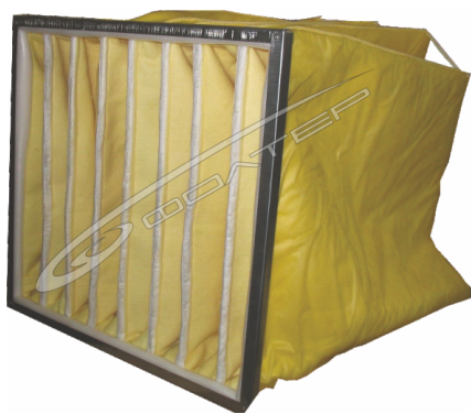
Рис.1. Фильтр ИФК

Фильтры типа ИФК предназначены для очистки приточного и рециркуляционного воздуха в системах вентиляции и кондиционирования от газообразных и паровых загрязнений кислой и основной природы. Фильтры с анионообменным материалом МИОН АК-22 предназначены для очистки воздуха от кислых газов и паров: диоксида серы, фтористого водорода, хлористого водорода, бромистого водорода, диоксида азота, молекулярного хлора, брома,