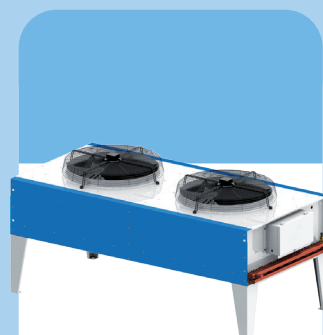
ДВУХВЕНТИЛЯТОРНЫЙ НАРУЖНЫЙ БЛОК