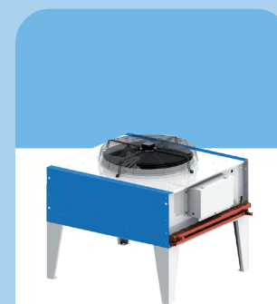
ОДНОВЕНТИЛЯТОРНЫЙ НАРУЖНЫЙ БЛОК