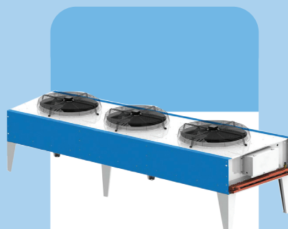
ТРЕХВЕНТИЛЯТОРНЫЙ НАРУЖНЫЙ БЛОК